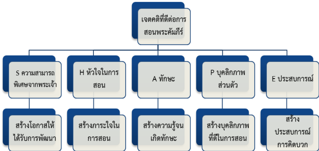
เจตคติที่ดีต่อการสอนพระคัมภีร์ตามแบบ SHAPE Model

ข้อเสนอแนะจากการศึกษาในครั้งนี้พบว่า การที่จะสร้างเจตคติที่ดีให้กับผู้สอนในการทำพันธกิจในด้านการสอนพระคัมภีร์ได้นั้นจะต้องมีการร่วมมือระหว่างผู้นำในคริสตจักรที่มีส่วนในด้านพันธกิจคริสเตียนศึกษาและผู้สอนในการสร้างและพัฒนาไปพร้อมๆกัน ซึ่งในแง่มุมหนึ่งที่ได้จากการศึกษาหาเจตคติของผู้สอนที่มีต่อการทำพันธกิจด้านการสอนพระคัมภีร์ในคริสตจักรและองค์ประกอบที่ส่งผลต่อเจตคติของผู้สอนนั้น ผู้วิจัยจึงมีข้อเสนอแนะต่อผู้นำในคริสตจักรที่มีส่วนในด้านพันธกิจคริสเตียนศึกษา ดังนี้